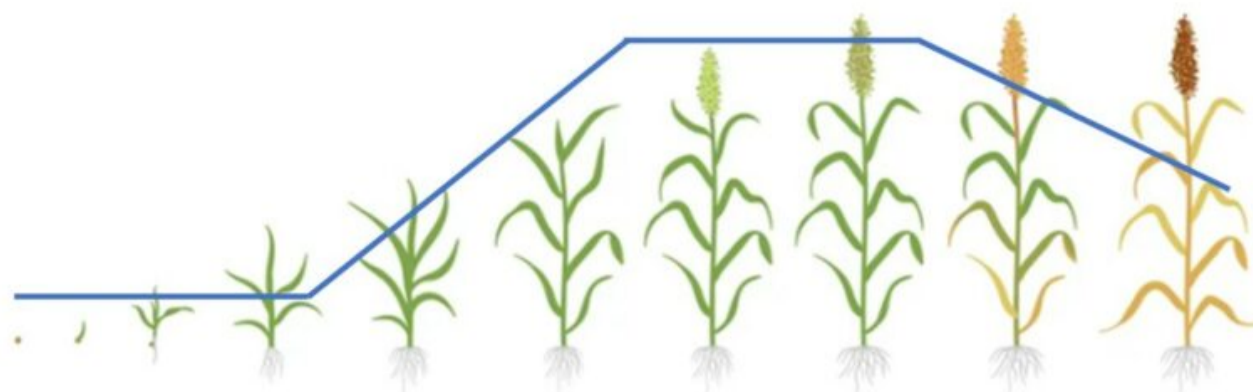
Figura 2. Necessitats d'aigua en funció de l'estadi fenològic.

Durant el període d'emissió de la panícula i la floració és quan el sorgo és més sensible a l'estrès hídric. Si es dona estrès hídric entre l'estadi de 8 fulles i el final de l'encanyat es pot penalitzar l'aparició de les panícules i afectar el rendiment.