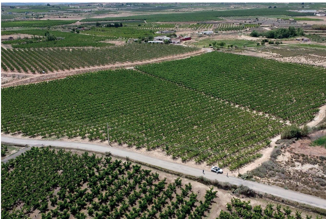
Figura 1. Imagen aérea del campo comercial donde se realizó el ensayo (Aitona, Lleida).

cosecha, los árboles aún están activos y son capaces de absorber los nutrientes fácilmente y acumularlos en órganos de reserva. Tener una buena reserva de nutrientes en el árbol antes de la parada invernal es muy importante para garantizar una rápida entrada en producción la siguiente campaña.