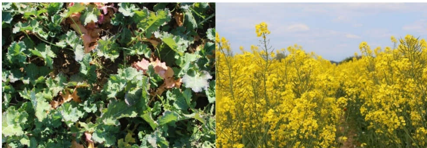
Figura 1. Imágenes del cultivo de colza en los estadios de desarrollo de roseta –enero 2021- (a la izquierda), y de floración –abril 2021- (a la derecha).

Existen, por tanto, dos momentos claves para la fertilización del cultivo. El primero es antes de la siembra (fondo), en el que, en su caso, es necesario aportar nutrientes, especialmente nitrógeno, para asegurar llegar a la salida de invierno con un mínimo de biomasa producida, y poder asegurar, así, una buena base para conseguir un rendimiento elevado. El segundo momento (cobertura) es antes del inicio de la elongación del tallo, donde hay que asegurar un suministro suficiente de nitrógeno durante el período de máximas extracciones.