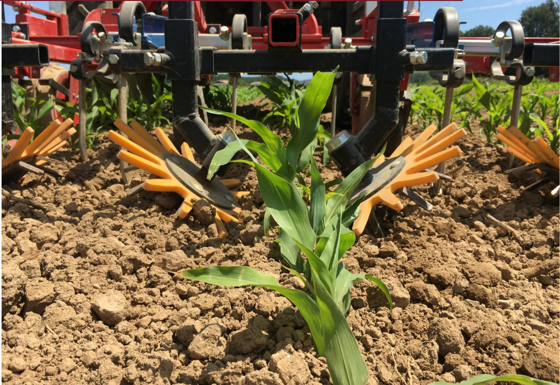
Figura 3. Detall dels dits flexibles d'una binadora

L'eficàcia en el control de les herbes és molt variable, ja que depèn de diversos factors: l'estadi de les herbes, l'estat del sòl, la climatologia posterior al desherbatge, etc. Per això, aquesta estratègia es recomana només en parcel·les que tenen una infestació inicial d'herbes baixa. És la més important en agricultura ecològica.