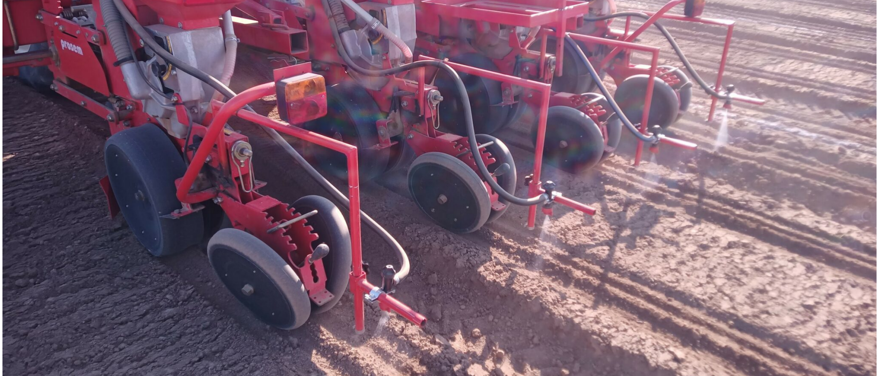
Figura 4. Aplicació d'herbicida a bandes durant la sembra