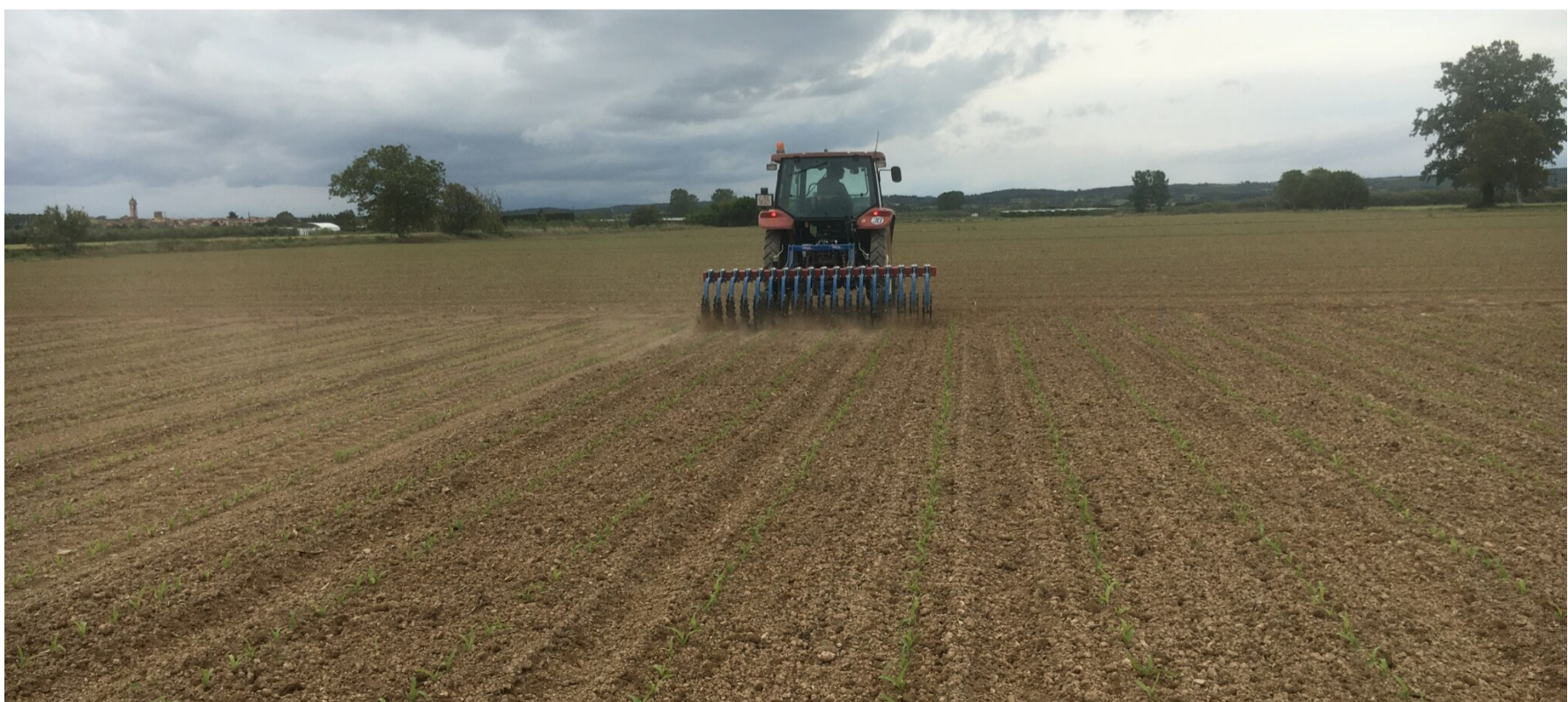
Figura 2. Desherbatge amb el rascler rotatiu d'estrelles

El rascler rotatiu d'estrelles. El seu ús està indicat un cop efectuada la sembra (00-05 BBCH) i entre els estadis de 3 a 5 fulles (13-15 BBCH). Les eficàcies més altes s'aconsegueixen quan les herbes estan poc desenvolupades (no han superat l'estadi de 2 fulles).