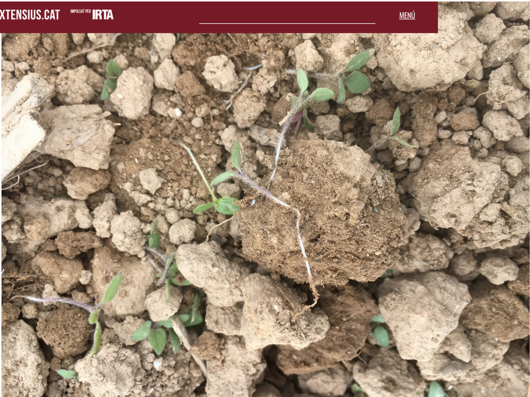
Figura 1. Control d'herbes amb desherbatge mecànic