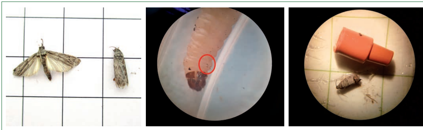
FIG. 3 De izquierda a derecha mariposa y larva de Ectomyelois ceratoniae , adulto y feromona de Cydia pomonella . (Foto: IRTA, Programa de Fruticultura). Para más información https://idtools.org/id/leps/lepintercept/ceratoniae.html .

tos aplicables para su control la búsqueda se debe centrar en el nombre vulgar de la plaga, orugeta, o nombres genéricos como lepidóptero, orugas, larvas de insectos. Hemos de tener muy presente que este registro se actualiza con la tendencia de que los nombres genéricos vayan desapareciendo; así en la nueva jerarquía de plagas, enfermedades y malas hierbas del registro de productos fitosanitarios de la página del MAPA ( https://www.mapa.gob.es/es/agricultura/temas/sanidad-vegetal/productos-fitosanitarios/registro-productos/ ) la nueva clasificación de plagas cita ya a esta plaga en la categoría de barreneta de los cítricos, Apomyelois ceratoniae , nombre científico