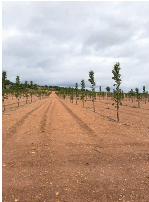
Plantación de nogal variedad Chandler en la que se está realizando la formación en eje libre.

Para mejorar el control de carpocapsa, se puede también interceptar el descenso de las orugas de la tercera generación por el tronco, para invernar en el suelo, colocando cartones corrugados en la