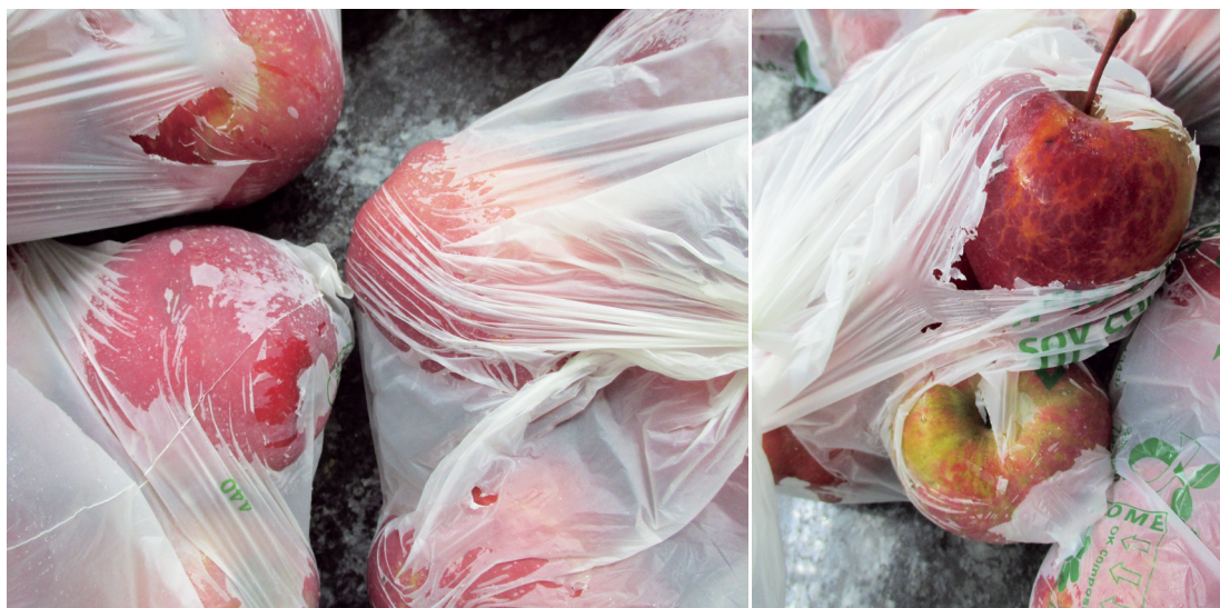
Fotos 4 y 5. Aspecto de las bolsas compostables de bajo gramaje después de una conservación frigorífica de 7 días.

En un ensayo realizado por nuestro grupo, el Servicio Técnico Postcosecha del IRTA, dentro del Grupo Operativo citado anteriormente, se evaluaron bolsas compostables de maíz y de yuca de diferentes gramajes (11, 15 y 18 \mu\text{m} ) y se compararon con las bolsas LDPE que actualmente se usan para el envasado de fruta fresca, y se analizaron sus características a nivel de resistencia, transparencia y manejo des-