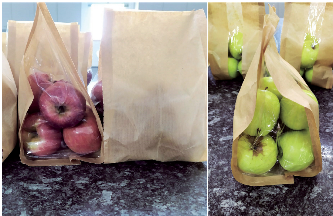
Fotos 7 y 8. Detalle de las bolsas de PLA + papel Kraft, modelo A, sin ventana frontal (izda.) y modelo B, con ventana frontal (dcha.).

poliláctico (PLA), ya que tiene unas propiedades similares al PE y, además, es biodegradable y compostable. No obstante, hay que ha-