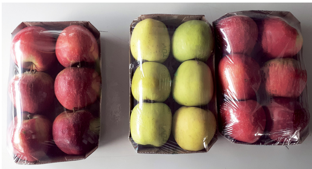
Fotos 14: Envasado con film estirable plástico (bandeja de la izda.) y con film compostable (las dos bandejas de la dcha.).

modelo A de estas bolsas, no sería una buena alternativa a las bolsas plásticas ya que después de 2-3 semanas de conservación frigorífica, un 15% de bolsas se rompieron por la zona de unión entre el PLA y el papel Kraft.