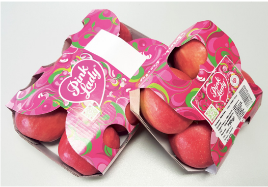
Foto 17. Fajado en manzanas.

Algunos de estos elementos auxiliares, usados en el etiquetado del producto son, las etiquetas de corbata, que se usan para cerrar envases de malla. La alternativa sostenible para el etiquetado de corbata sería las corbatas compostables fabricadas a base de celulosa y combinados con la grapa POLY CLIP®, ideales para el etiquetado y grapado de frutas y verduras en malla compostable. Otros elementos auxiliares a tener en cuenta, son los stickers , pegatinas de PP que se pegan a las frutas o verduras de forma individual, pueden mostrar información de la marca del producto (Zespri®, Pink lady®, etc.), el código de barras, QR, etc., y que pueden ser sustituidos por stickers de celulosa.