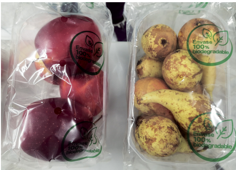
Foto 16. Envasado Flow pack con film de PLA.

teriales como la fibra de palma, yuca, madera, etc. (que ya hemos citado anteriormente).