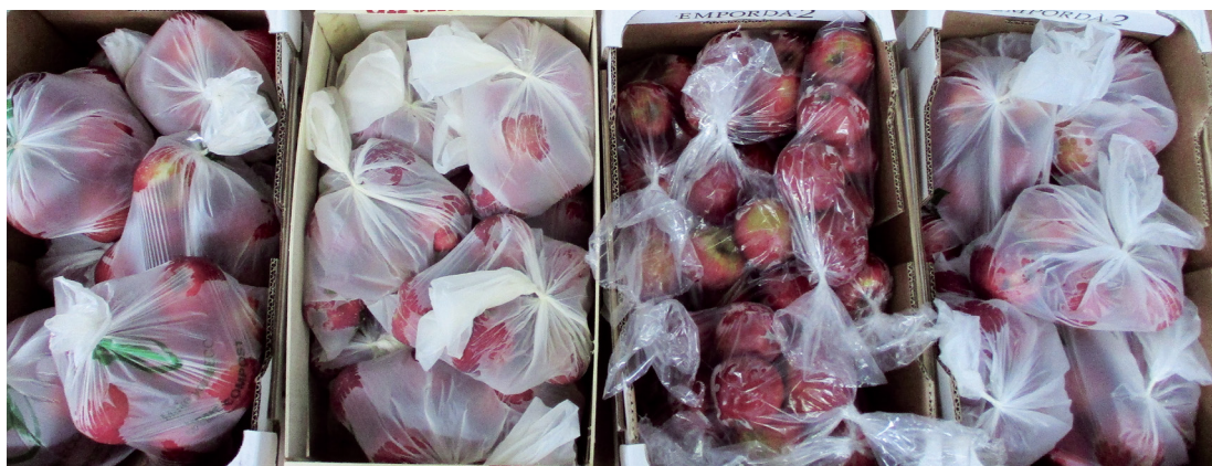
Foto 3. Envasado con bolsas compostables de diferentes materiales y gramajes, de izda. a dcha.: yuca 18 mm, maíz 15 mm, plástico convencional y yuca 11 mm.