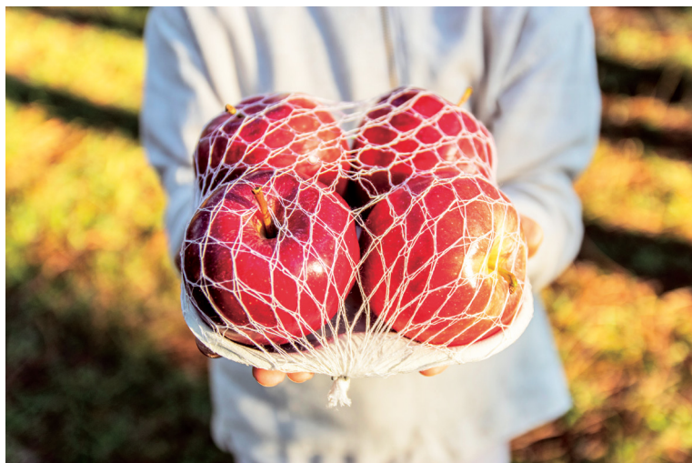
Foto 13. Alternativa al envasado con film retráctil, envasado con bandeja de cartón y malla compostable.