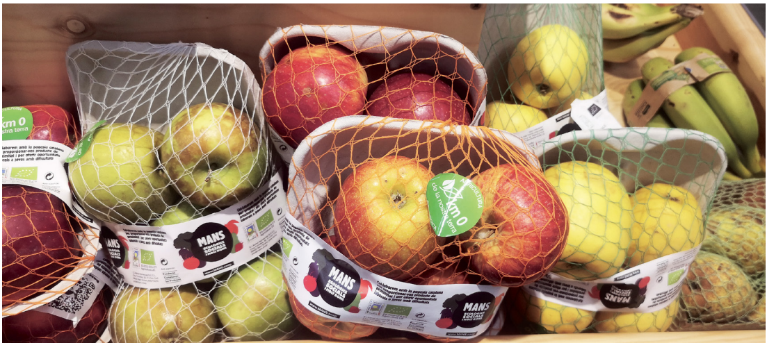
Foto 15. Envasado con bandeja de fibra de palma y malla compostable sustituyendo el envasado en film retráctil.