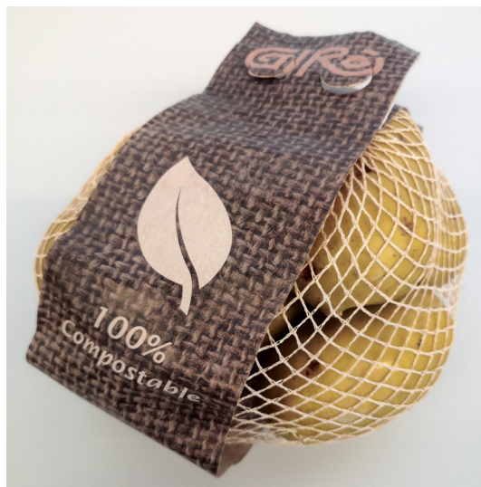
Foto 6. Ejemplo de malla compostable.

poliláctico (PLA), ya que tiene unas propiedades similares al PE y, además, es biodegradable y compostable. No obstante, hay que ha-