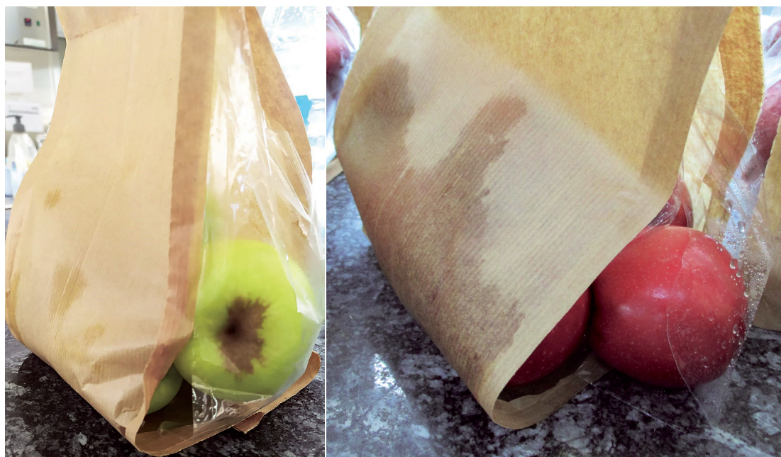
Fotos 9 y 10: Detalle del modelo A de las bolsas de PLA + papel Kraft rotas después de 2 semanas en conservación frigorífica.