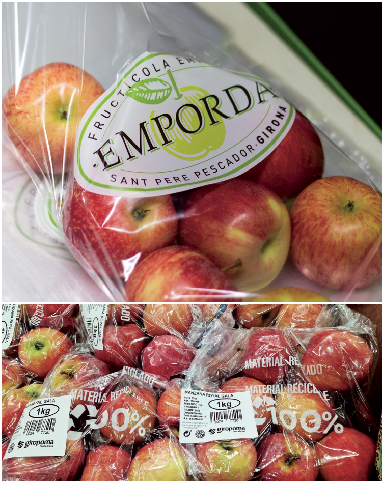
Fotos 1 y 2. Bolsa de polietileno de baja densidad (LDPE) arriba, y bolsa de Polipropileno (PP) reciclado al 100%, abajo.

de la malla son la resistencia, ya que un gramo de malla permite soportar hasta 1 kg de peso, la transpirabilidad ya que la estructura de retícula de la malla permite que el producto transpire y la visibilidad del producto envasado.