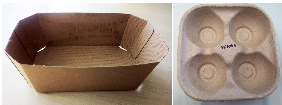
Fotos 11 y 12: Detalle de las bandejas sostenibles fabricadas de cartón (izda.) y de fibra de palma (dcha.).

cer un inciso en la compostabilidad del PLA; es compostable en una planta de compostaje industrial (se necesita una determinada humedad relativa y una temperatura de 55–70°C para degradarse en pocos meses), al aire libre tarda 80 años en degradarse. Sin embargo, no todo son ventajas con los bioplásticos, y con el incremento de su uso en la industria del packaging surge la duda de si es éticamente justificable fabricar plástico a partir de alimentos