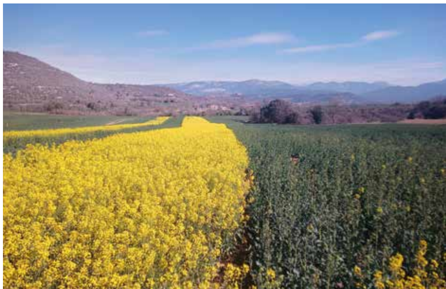
CUADRO XI. RENDIMIENTO E ÍNDICE PRODUCTIVO DE LAS VARIEDADES DE COLZA DE OTOÑO EN LOS ENSAYOS DE REGADÍO EN LA CAMPAÑA 2022/23, EN EL MARCO DE LA RED GENVCE.