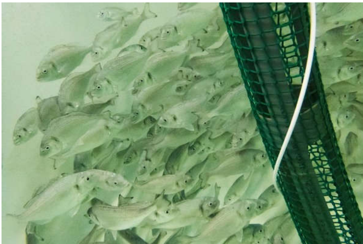
Foto 3. Estanque con doradas en el IRTA

La composición del filete (Tabla 4) en ambas especies mostró un mayor contenido de proteína cuando los peces fueron alimentados con el mayor nivel de inclusión de proteína de guisante. A su vez, los lípidos también tuvieron los niveles más bajos en los peces alimentados con el mayor contenido de proteína de guisante.