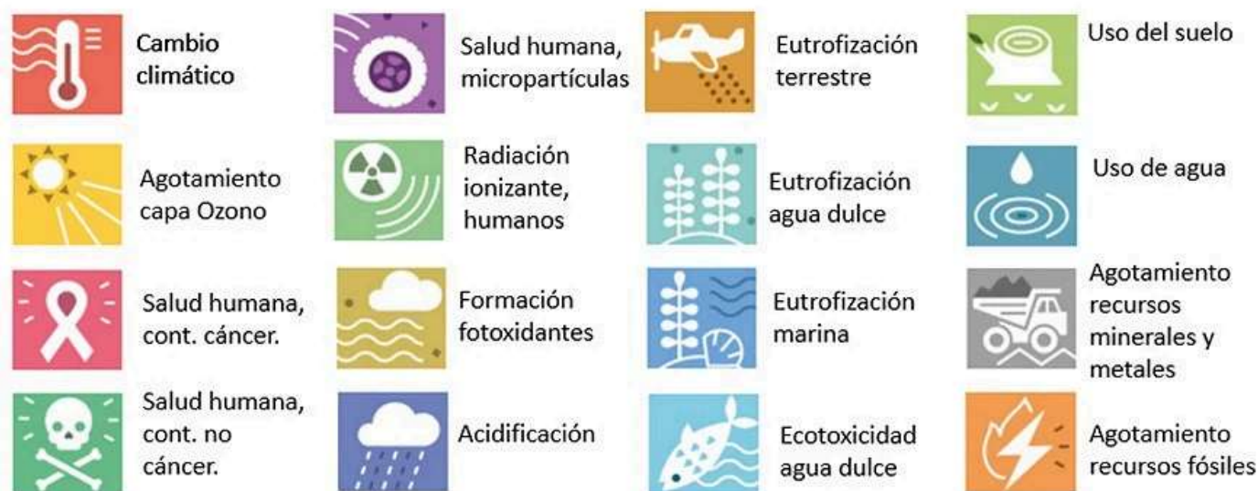
Figura 2. Categorías de impacto evaluadas de acuerdo con la metodología PEF de CE. Imágenes adaptadas de CE (2021b).

El estudio se realizó calculando los impactos ambientales por unidad de producto. Para la leche se usó un litro de leche corregida en grasa y proteína (FPCM, por sus siglas en inglés fat and protein corrected milk ) y para la carne se usó un kilogramo de carne canal. Como mencionado anteriormente, el alcance del estudio incluyó todas las etapas de la cadena de valor desde la cuna (obtención de las materias primas) hasta la distribución de los dos productos estudiados a centrales de distribución y de supermercados, pasando por granja, transporte entre eslabones, así como planta lechera y matadero respectivamente. El estudio consideró 3 granjas de leche y 2 de carne con sistemas productivos mayoritarios en nuestra área geográfica. Se obtuvo el resultado para 16 categorías de impacto (entre ellos huella de carbono y agua, así como acidificación, eutrofización y material particulado, indicadores que están estrechamente relacionados con la producción animal) (Figura 2) para las cuales existe un modelo de cálculo estandarizado y recomendado por la Comisión Europea. En la actualidad IRTA está trabajando en el desarrollo de modelos que servirían para completar estas evaluaciones y medir también los beneficios ambientales de modelos productivos asociados con efectos positivos sobre el secuestro de carbono, servicios ecosistémicos y fomento de la biodiversidad.