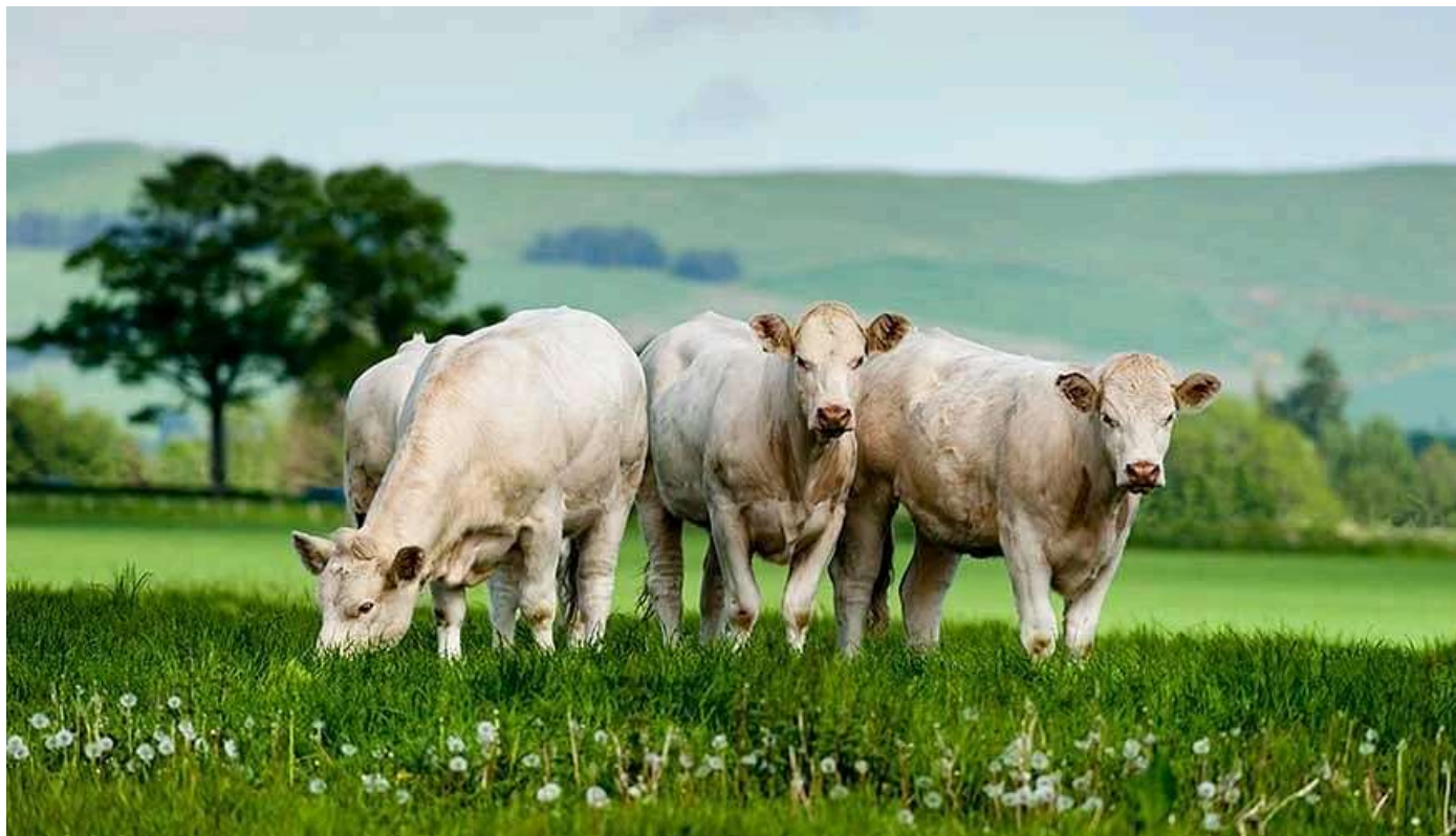
Vacas de raza Charolesa.