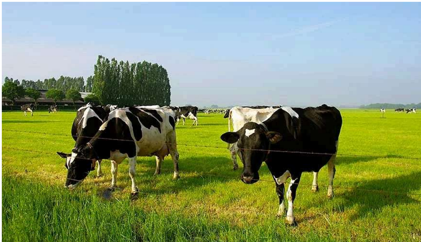
Vacas de aptitud láctea en una pradera.