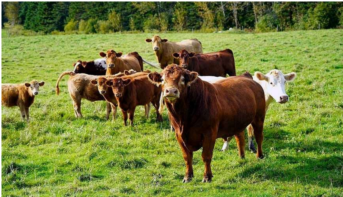
Ejemplares de la raza Limusín.