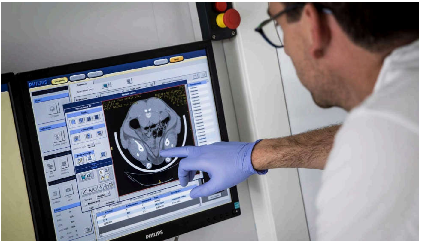
Visualización de las imágenes obtenidas de un cerdo vivo con el tomógrafo.

La TC, al ser una tecnología no invasiva posee un gran potencial en ganadería. La utilización de esta tecnología en producción animal ofrece nuevas vías para la mejora productiva, ya que puede utilizarse para estimar diferentes parámetros tanto a nivel de granja como de sala de despiece o industria procesadora.