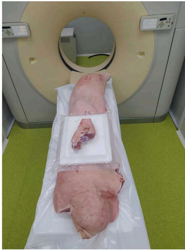
Escaneo de una canal.