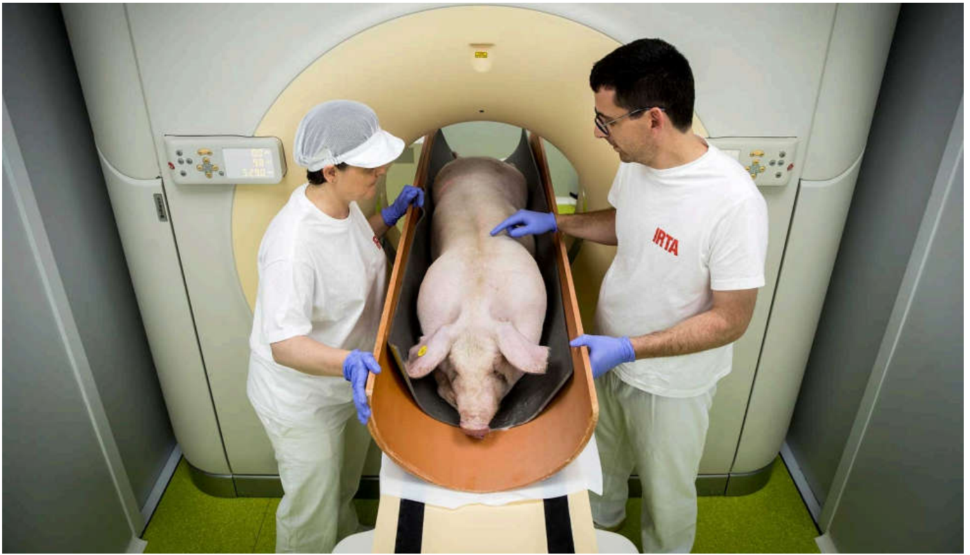
Escaneo de un cerdo vivo.

La teoría de la TC se fundamenta en el coeficiente de atenuación que experimenta el haz de rayos X al atravesar la materia recogida por los detectores, los cuales giran 360° alrededor del objeto y de manera sincronizada con la fuente de rayos X.