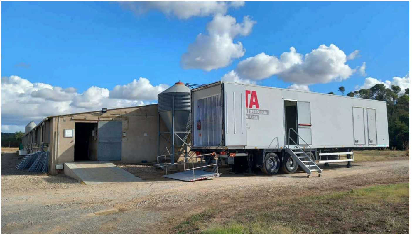
Tráiler con el equipo de tomografía computarizada situado en la granja.

Antes era necesario trasladar a los animales desde la granja hasta el enclave en la que se encontrara el equipo. A partir de ahora ya no es necesario, pues el IRTA ha adquirido un equipo de TC móvil que permite desplazar al equipo hasta la granja o matadero sin necesidad de desplazar a los animales. Este hecho supone una gran innovación ya que permite una mejor aplicación de la tecnología en el territorio, favoreciendo al sector y dando la oportunidad a más empresas que quieran aplicar esta tecnología.