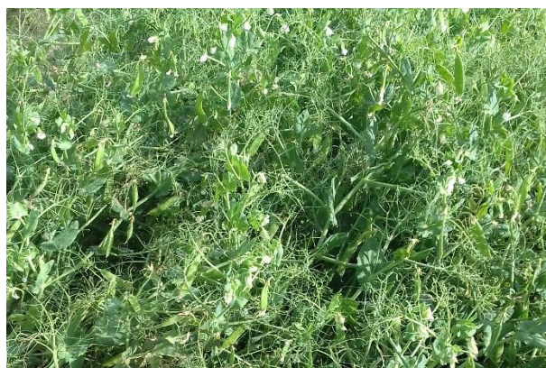
Figura 2. Varietat BLUETOOTH

Contingut en proteïna: Baix a Mitjà (- 1,1 % / MYTHIC)